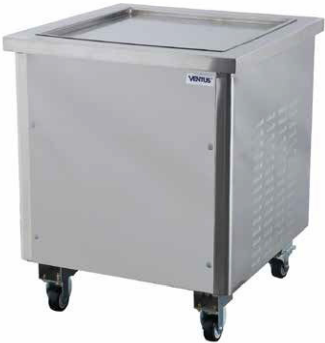
* Fotografía de referencia.