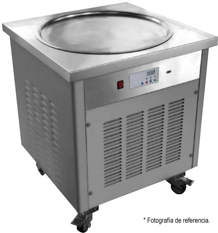
* Fotografía de referencia.