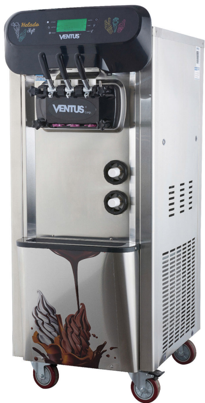
*Imagen de referencia.