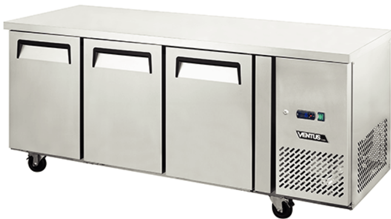
Controlador Digital Carel

Equipo ideal para preparación y refrigeración de productos