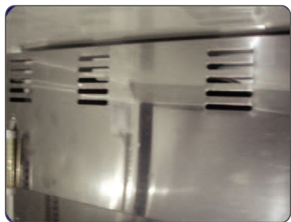
DETALLE DE PUERTAS (SISTEMA DE AUTO CIERRE)