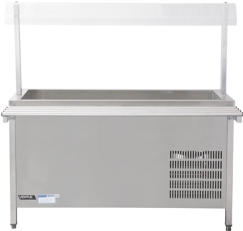
* Fotografía de referencia.