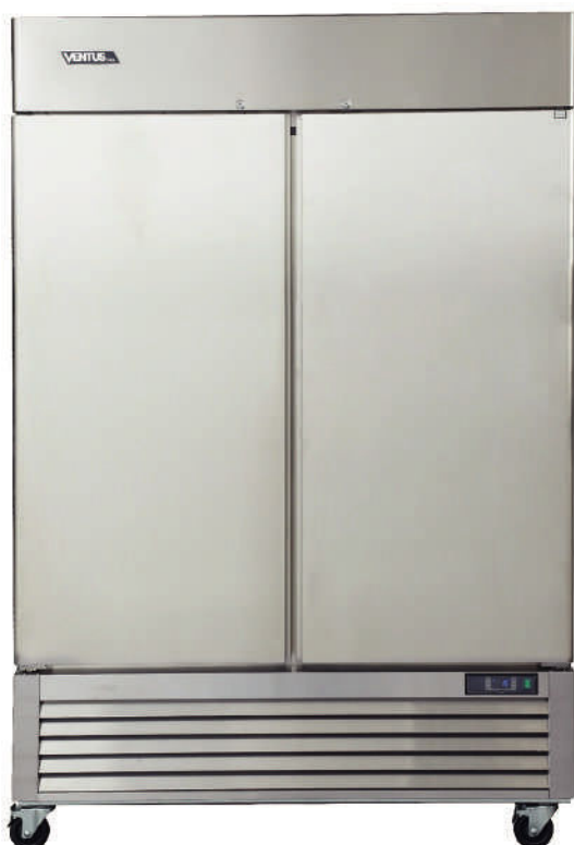
Controlador Digital Carel

Equipo ideal para comercio y cadenas Food Service