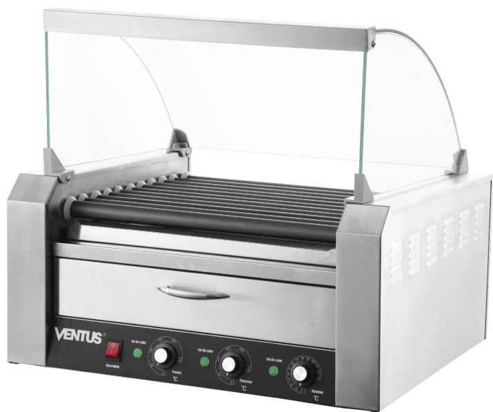
* Fotografía de referencia.