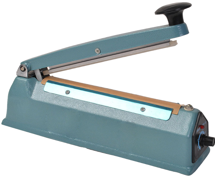
* Fotografía de referencia.