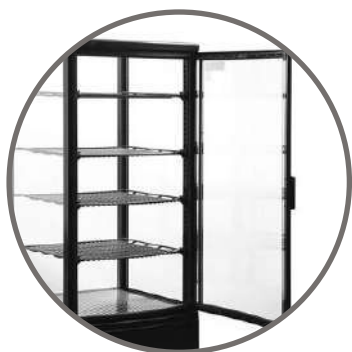
Puerta frontal abatible

Equipo ideal para mantención y exhibición de productos