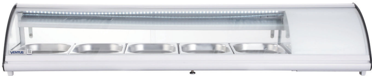
* Fotografía de referencia.