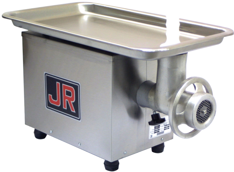
* Fotografía de referencia.